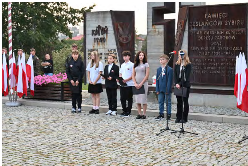
Uczniowie Szkoły Podstawowej Nr 15 im. A. Mickiewicza w Przemyślu