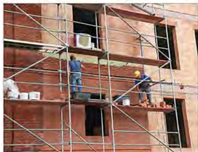
Tyma odbudowa budynku (stan z lata 2023 roku) z przeznaczeniem na cele muzealne

Te same budynki, druty kolczaste, wieżyczki strażnicze wykorzystali do swoich zbrodniczych celów sowieccy „wyzwoliciele”