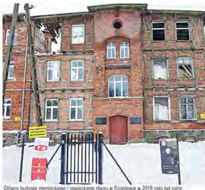
Główny budynek niemieckiego i sowieckiego obozu w Działdowie w 2016 roku był ruiną

Wydaloby się, że wejście Sowietów do miasta w styczniu 1945 roku zakończy ostatecznie istnienie obozu. Przez dekady w historiografii mówiono się przecież o „wyzwoleniu”, które przyniosła Armia Czerwona. Tymczasem te same budynki, druty kolczaste, wieżyczki strażnicze wykorzystali do