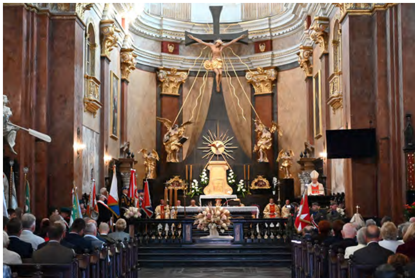
Uroczysta Msza św. w kościele o.o. Karmelitów Bosych