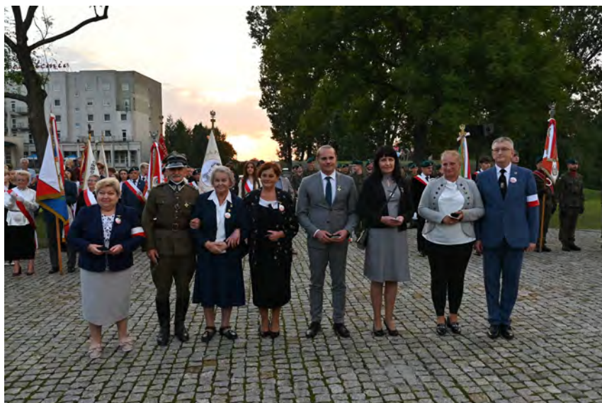
Osoby zasłużone dla Związku Sybiraków