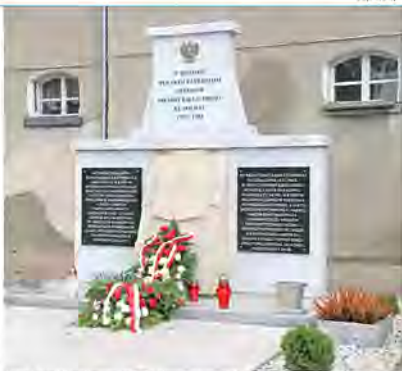
Formik w pobliżu głównego budynku obozowego upamiętnia niemieckie i sowieckie ofiary

Stosunek personelu obozowego do osadzonych był obojętny lub wrog.