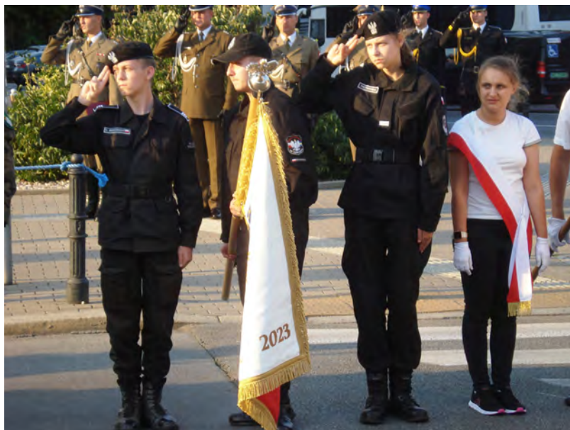
Poczet Sztandarowy Liceum z Komornicy