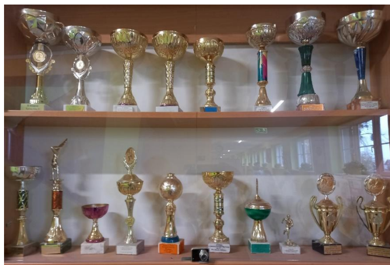
Dyplomy, a głównie puchary w SP nr 95 świadczą o wysokim poziomie nauki, wiedzy uczniów, wyczynów sportowych ... itd. To świadczy o wysokiej ... KLASIE SZKOŁY!