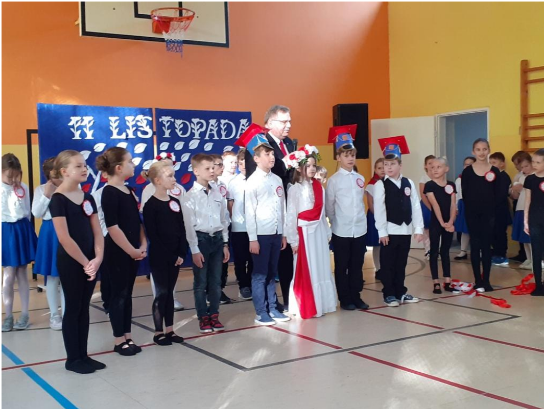
Zespół artystyczny z p. Dyrektorem w SP nr 71