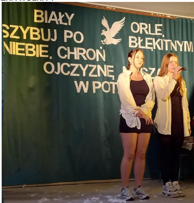
Całość sali razem z CHÓREM odśpiewała Hymn POLSKI.