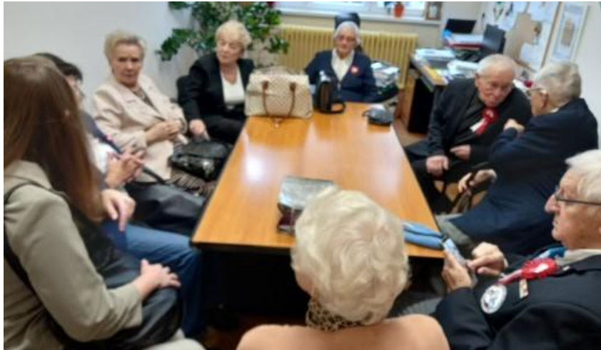
Rozmowy w gabinecie p. Dyrektora /przed uroczystością/