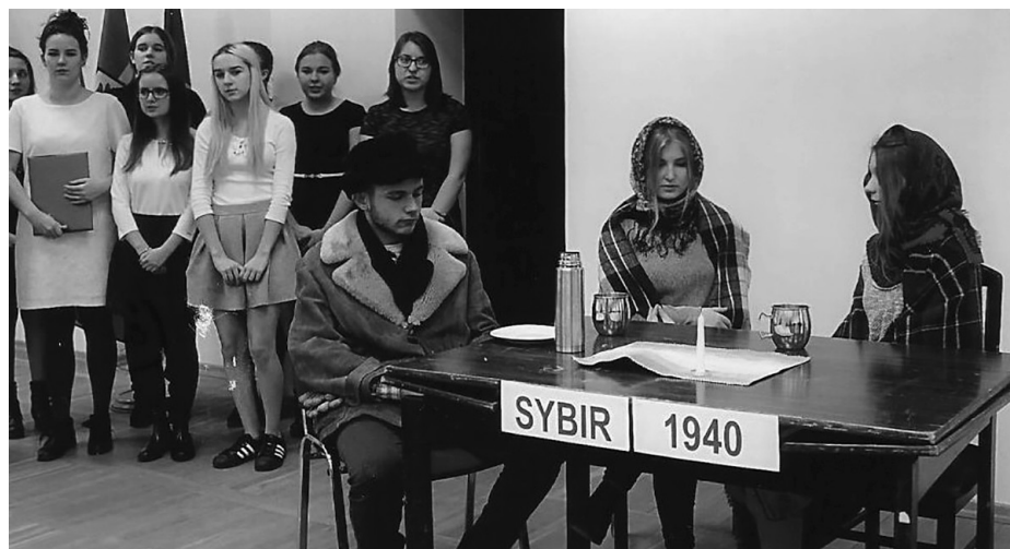
Młodzież z Zespołu Szkół Mechanicznych im. Zesłańców Sybiru w inscenizacji „Wigilia na zesłaniu”