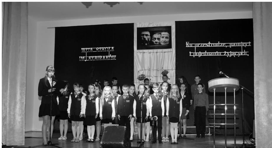
Część artystyczna przedstawiona przez uczniów Szkoły Podstawowej im. Sybiraków w Nawsiu

Nabożeństwo sprawowane było w intencji sybiraków oraz za całą społeczność szkoły. W kazaniu ksiądz biskup w sposób szczególny wyraził uznanie za pielęgnowanie pamięci o sybirakach, szkołę patriotyzmu oraz miłości Boga i bliźniego.