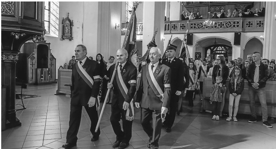
Honorowe wprowadzenie pocztów sztandarowych do kościoła w Ścinawie