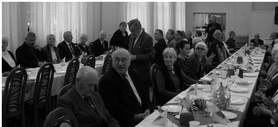
Spotkanie opłatkowe sybiraków wrocławskiego Oddziału