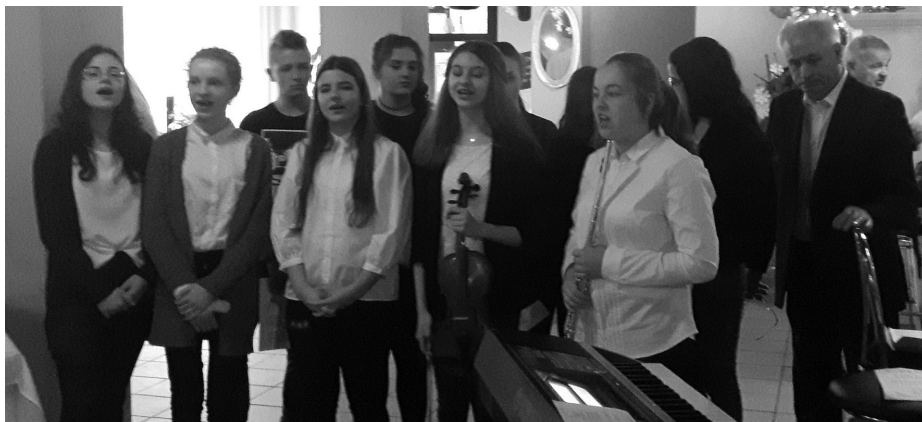
Koncert kolęd przygotowała młodzież Szkoły Podstawowej nr 6

mili, że sybiracy przyszedli najpierw do kościoła po błogosławieństwo, aby później świętować w gronie przyjaciół. Podkreślił również, że ci niezwykli ludzie to żywi świadkowie historii, dzięki którym nasz dumny naród, który szanuje i buduje wolność, miał szansę przetrwać. To m.in. ich patriotyzm przyczynił się do odzyskania przez Polskę niepodległości.