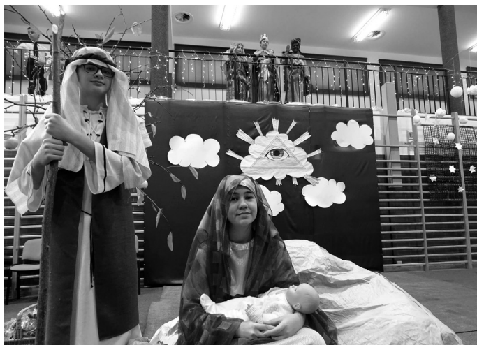
Jasełka przygotowane przez uczniów

Najważniejszym momentem dla wszystkich zaproszonych była chwila, gdy z opłatkiem w rękę podchodzili do starych przyjaciół i drżącym głosem składali sobie życzenia zdrowia, szczęścia i doczekania kolejnej wigilii.