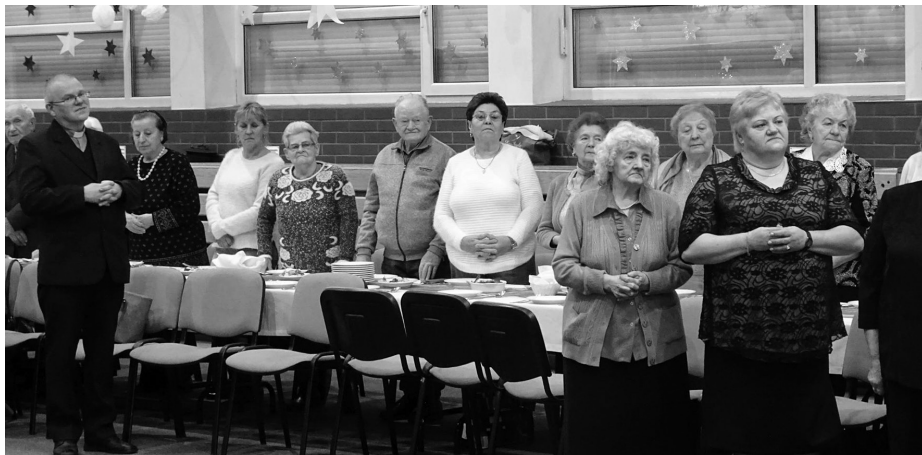
Spotkanie opłatkowe zgorzeleckich sybiraków