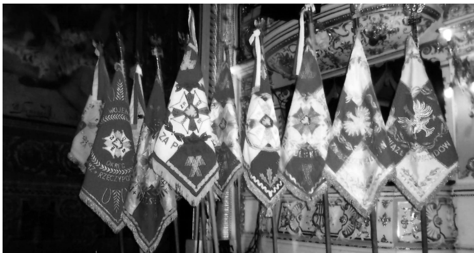
Sztaendary związkowe na scenie Teatru im. J. Słowackiego w Krakowie

Stąd dobre kontakty, które zaowocowały okazaną nam pomocą – Związek Inwalidów Wojennych użyczył pomieszczenie w swoim budynku, gdzie odbywały się zapisy i pierwsze spotkania organizacyjne tworzącego się w 1989 r. krakowskiego Oddziału Związku Sybiraków. Pamiętamy o tym z wdzięcznością.