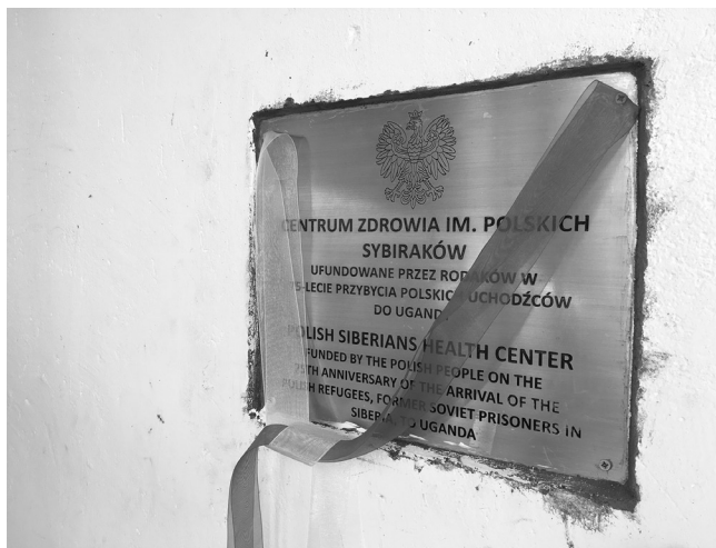
Tablica odsłonięta z okazji otwarcia Centrum Zdrowia