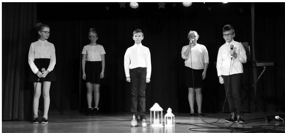
Występ uczniów Szkoły Podstawowej w Zalesiu