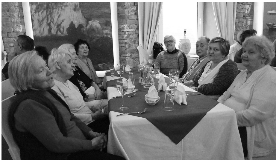
Spotkanie opłatkowe sybiraków Podbeskidzia

Po uroczystym powitaniu nastął czas na dzielenie się opłatkiem. Wszyscy obecni z uśmiechami na twarzach ruszyli złożyć życzenia swoim przyjaciołom, a także nieznanym. Później zasiedli do wspólnego posiłku.