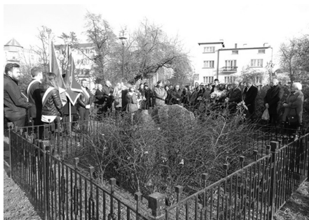
Uczniowie Zespołu Szkół Zawodowych im. Zesłańców Sybiru i zaproszeni goście na skwerze Sybiraków podczas Dnia Patrona szkoły