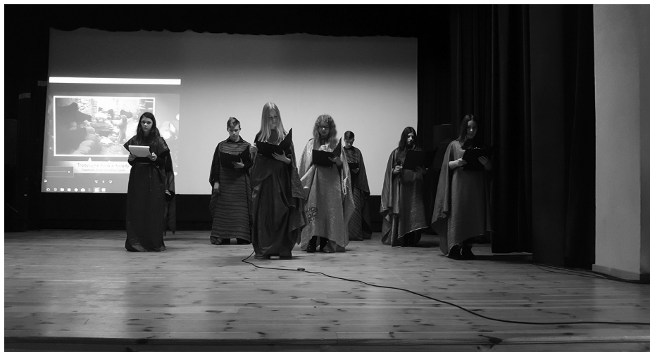
Występ ośmioosobowej grupki uczniów klasy VIId Szkoły Podstawowej nr 1 im. gen. Stanisława Dąbka w Lubaczowie w jasełkach sybirackich