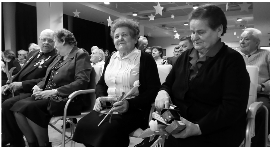
Podczas IV Spotkania Pokoleń w Oleszycach wręczono pamiątkowe statuetki w kształcie wagonu