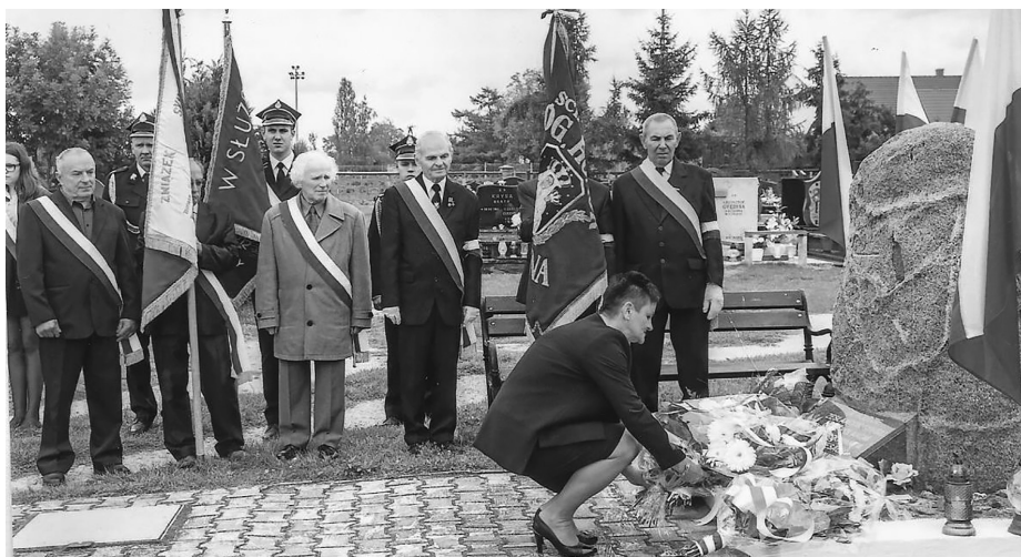
Złożenie kwiatów przed obeliskiem na cmentarzu komunalnym w Ścinawie