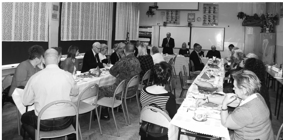
Spotkanie opłatkowe członków Stowarzyszenia Pamięci Ześlanych na Sybir oraz sybiraków