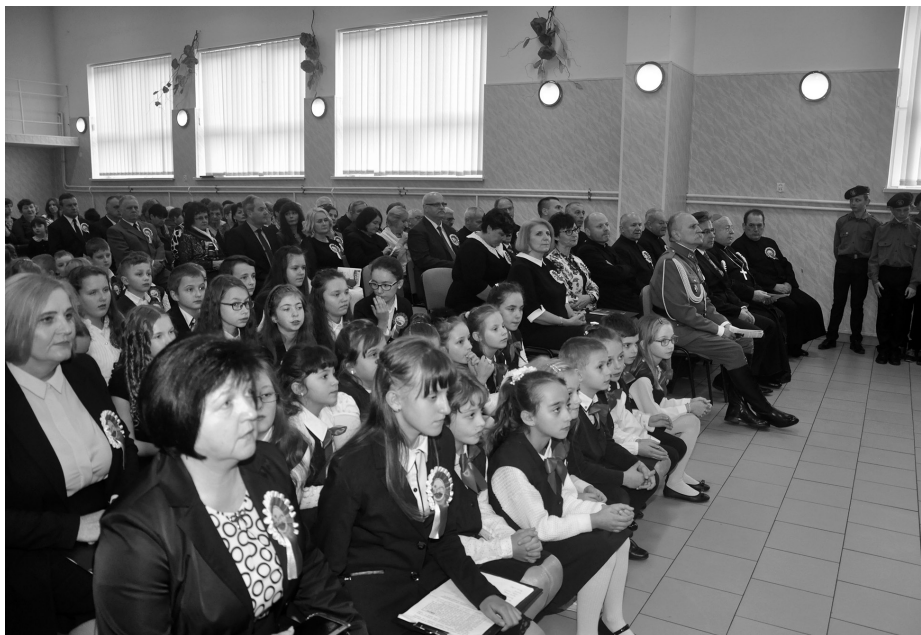
Zaproszeni goście w sali w Domu Kultury

że bolesną kartę historii naszego narodu. Tematem programu były wybrane zdarzenia z tułaczki i niewoli zesłanych na Sybir.