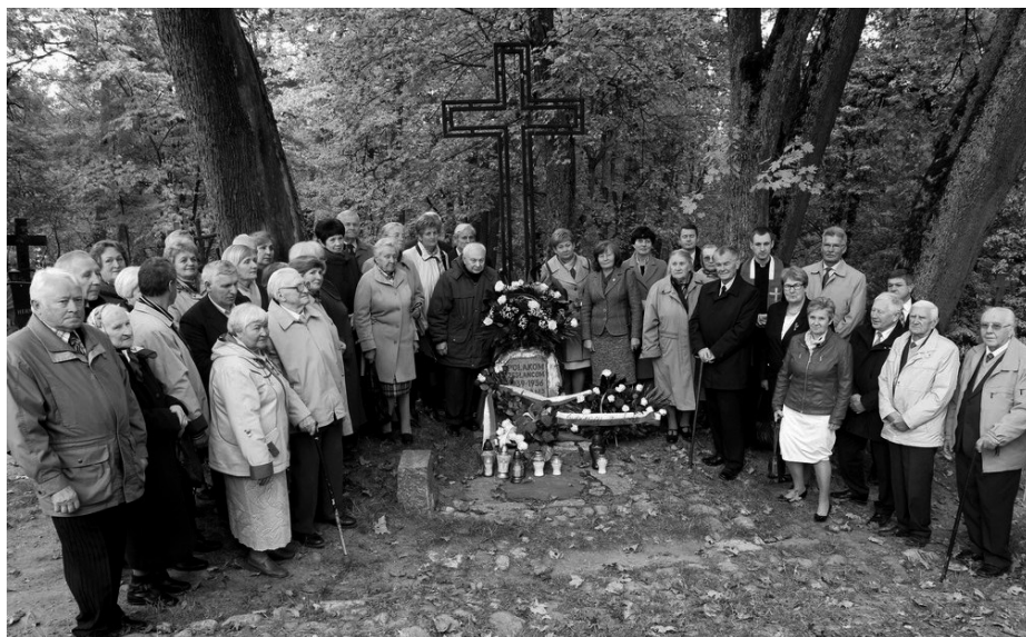
Uroczystość przy krzyżu – pomniku „Polakom Zesłańcom lat 1939–1956” w Kalwarii Wileńskiej

Po nabożeństwie wileńscy sybiracy, członkowie ich rodzin i goście udali się na cmentarz w Kalwarii Wileńskiej, gdzie przy krzyżu – pomniku