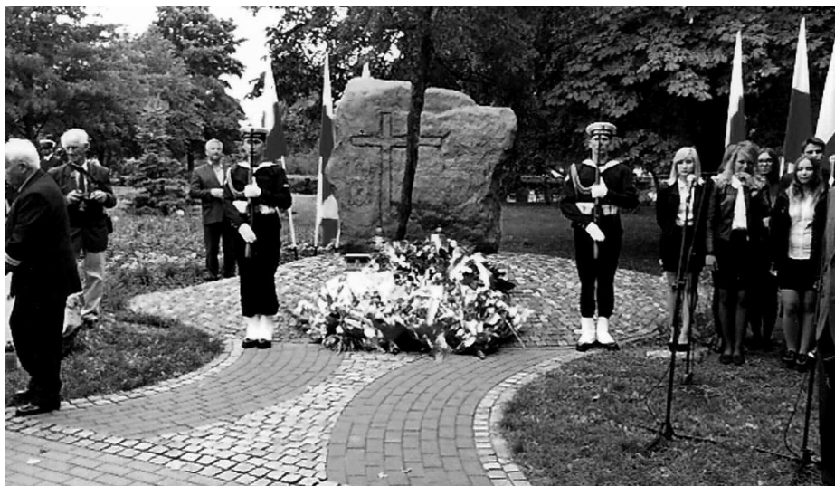
Warta honorowa wystawiona przez Kompanię Reprezentacyjną Marynarki Wojennej przy pomniku „W Hołdzie Zesłańcom Sybiru” (2008 r.)