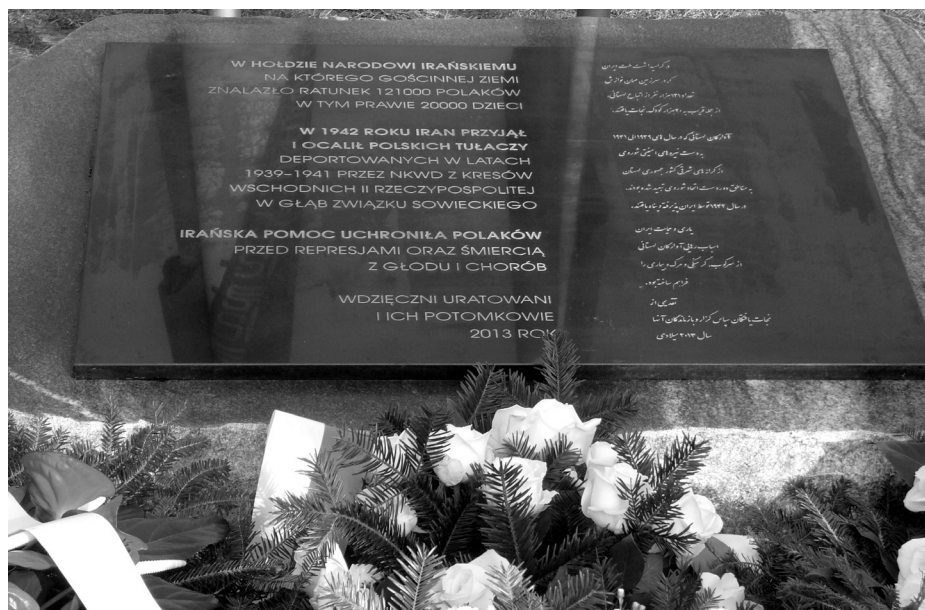
Tablica wdzięczności narodowi irańskiemu

Beata Żyłkowska