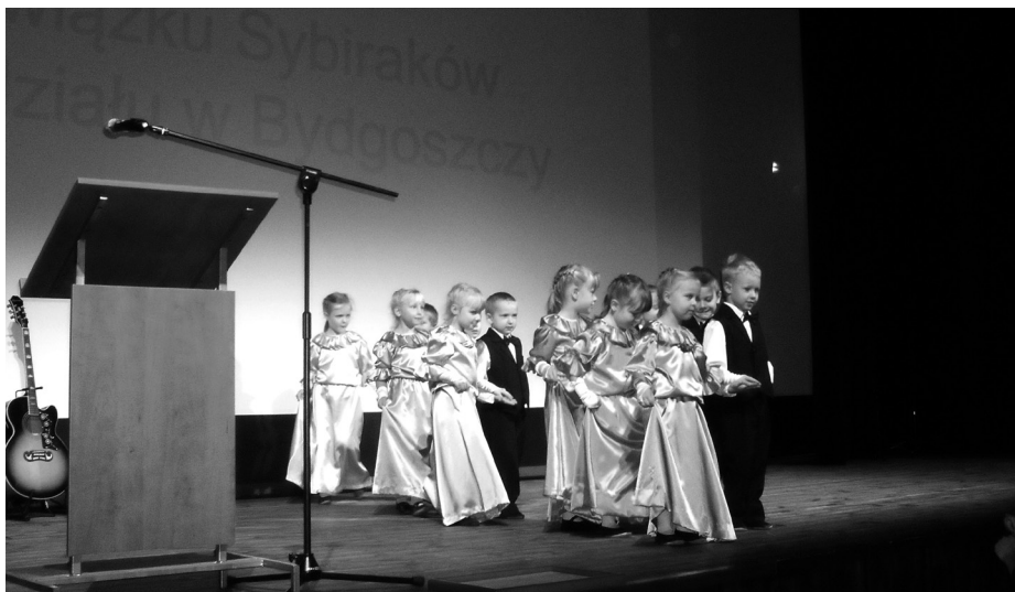
Najmłodzi artyści, którzy wystąpili podczas uroczystości – dzieci z Przedszkola nr 6 w Zespole Szkół im. H.Ch. Andersena