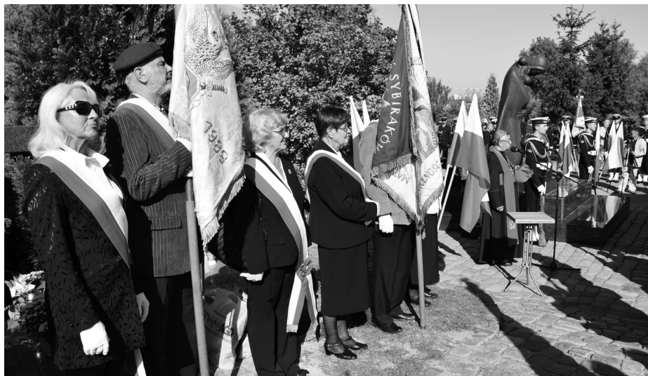
Modlitwę za zmarłych sybiraków odmówił ks. abp Sławoj Leszek Głódź

Jesteśmy wdzięczni obecnym władzom naszego miasta i województwa za życzliwe wspieranie naszej działalności oraz wszystkim, którzy nas wspomagają: naszym darczyńcom i sympatykom, dzięki którym mogliśmy zbudować ten piękny pomnik. Jesteśmy wdzięczni dyrekcji, gronu pedagogicznemu i młodzieży Gimnazjum im. Jana Pawła II za sprawowanie patronatu nad pomnikiem i tablicami, jako Miejscem Pamięci Narodowej, gdzie każdego roku wspólnie oddajemy cześć ofiarom, odmawiamy modlitwę, składamy wiązanki kwiatów i chronimy pamięć o nich i o naszej przeszłości z nadzieją, że taki los, jak 75 lat temu, Polsce się nie przydarzy”.