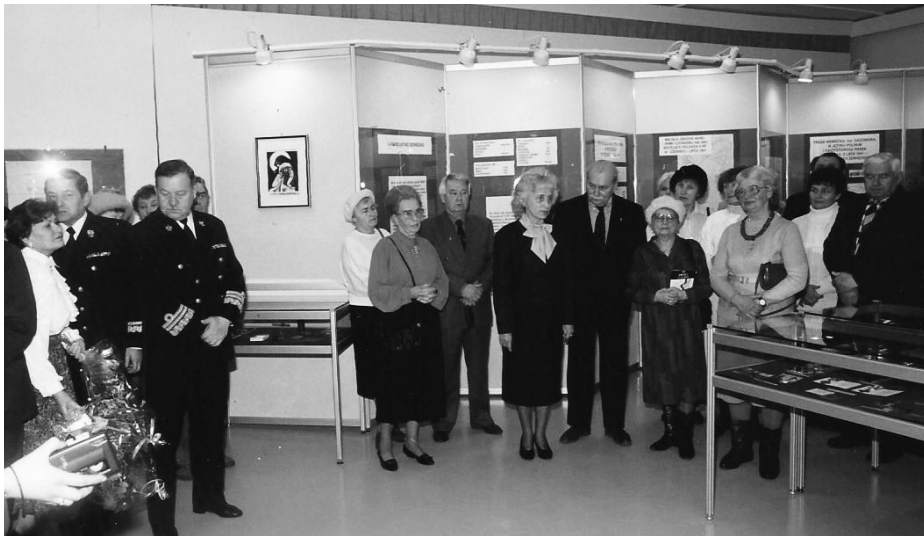
Otwarcie wystawy „Po agresji 17 września 1939 r.”, zorganizowanej przez Koło ZS w Gdyni

Oprócz wydawnictw książkowych członkowie naszego Koła publikują w kwartalniku „Rodowód” „Zesłaniec”, „Sybirak” oraz w „Komunikacie”