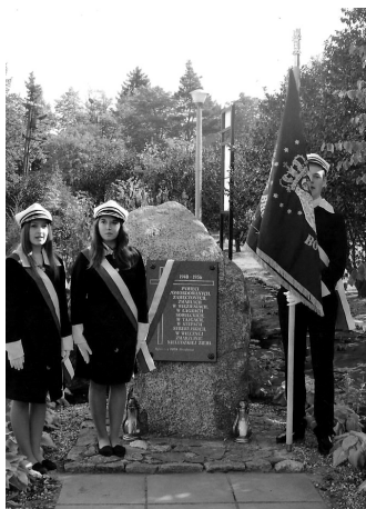
Poczet sztandarowy Zespołu Szkół Rolniczych przy obelisku poświęconym sybirakom