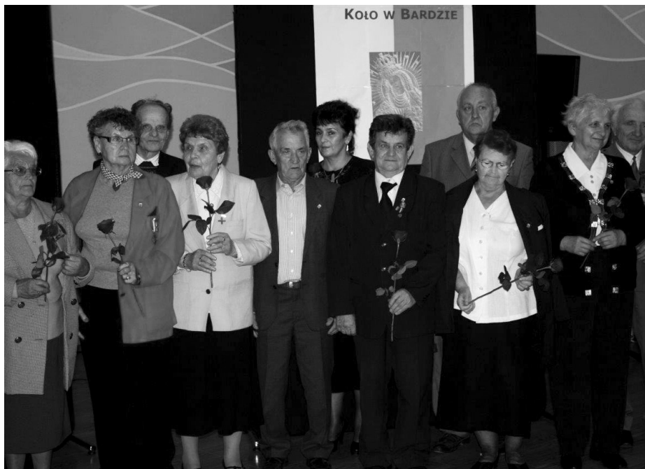
Sybiracy i kombatanci wyróżnieni przez burmistrza Barda

Następnie w Centrum Kultury i Promocji młodzież z Gimnazjum Publicznego w Przylęku i zespół Wiolinek słowami piosenek i wierszy wprowadziły zgromadzonych w nastrój zadumy i nostalgii.