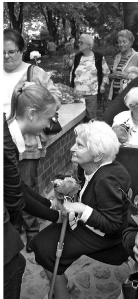
Kwiaty dla nielicznych już matek sybiraczek