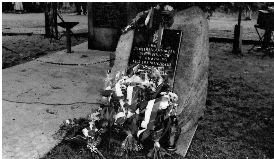
Obelisk Sybiraków w Gromadce