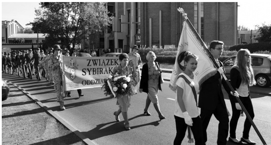
Ulicami miasta przeszedł Toruński Marsz Żywej Pamięci Polskiego Sybiru