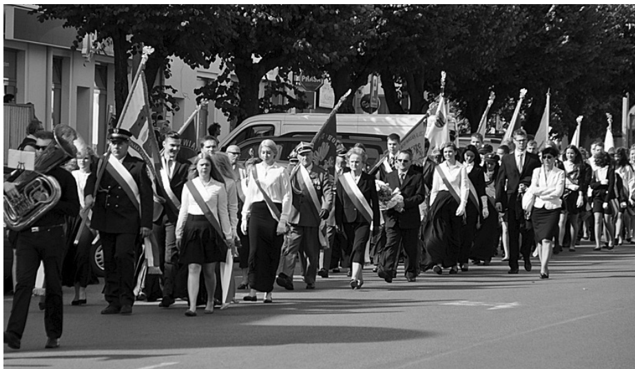
Uroczysty przemarsz ulicami Mławy pod pomnik Zesłańców Sybiru na cmentarzu parafialnym