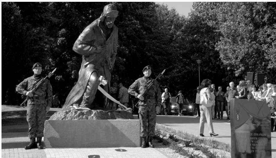
Pomnik Zesłańców Sybiru w Parku Sybiraków w Rzeszowie