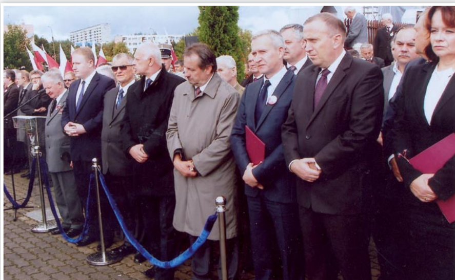
Przedstawiciele władz rządowych i samorządowych biorących udział w XI Marszu Żywej Pamięci Polskiego Sybiru w Białymstoku. Pierwsza od prawej – min. Barbara Kudrycka, marszałek Sejmu Grzegorz Schetyna