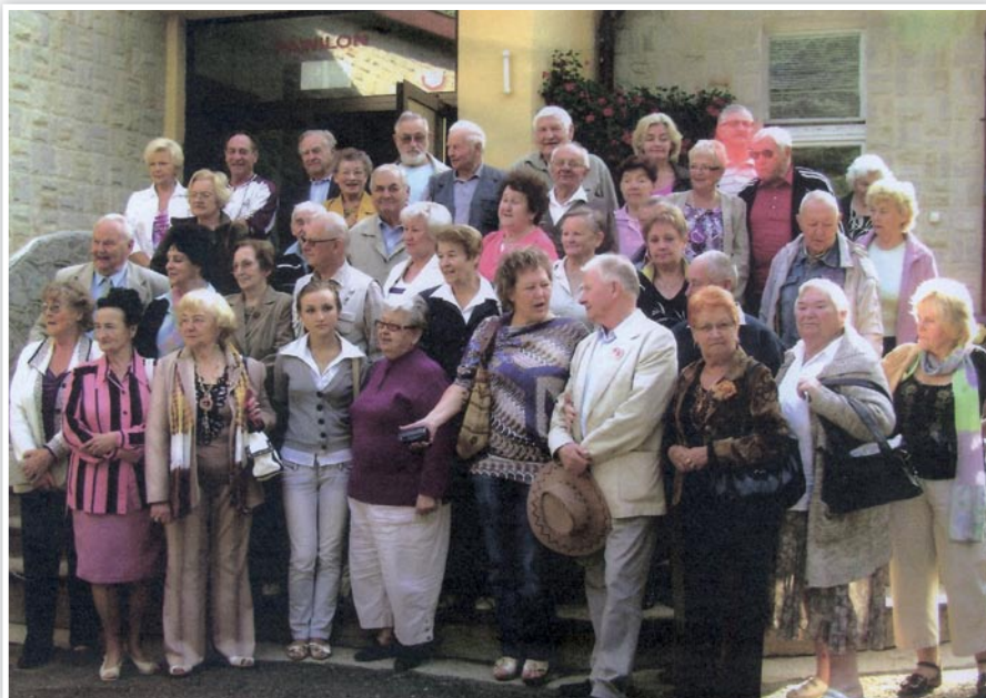
Wspólne zdjęcie uczestników