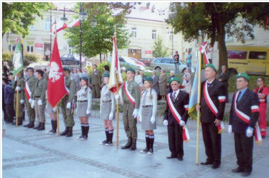
Uroczystości harcerzy z Hufca Przemyskiego z udziałem Sybiraków

Uroczystości w dniu 17.09 2011 r. odbywały się w różnych miejscach naszego miasta: w Przemyskiej Bibliotece Publicznej została otwarta wystawa i odbyła się sesja popularno-naukowa poświęcona Orłętom Lwowskim i Przemyskim w walce o niepodległość Polski. W kościele św. Brata Alberta uczestniczyliśmy we mszy św. pod przewodnictwem JE ks. abp. Józefa Michalika z udziałem pocztów sztandarowych i kompanii honorowej Wojska Polskiego w intencji ofiar sowieckiej agresji i zesłańców Sybiru oraz harcerzy Chorągwi Lwowskiej ZHP we Lwowie. Na cmentarzu wojskowym przy Grobie Nieznanego Żołnierza i Grobie Katyńskim odbyły się Apele Poległych prowadzone przez Wojsko Polskie, sybiraków i harcerzy oraz składanie kwiatów.