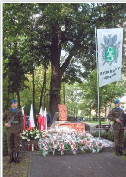
Po złożeniu kwiatów i zniczy pod Pomnikiem