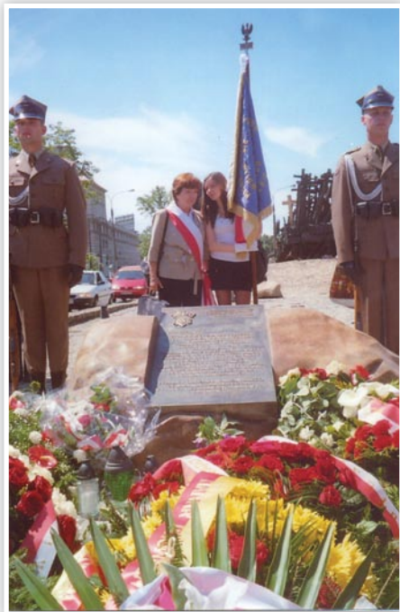
Tablica ku czci Matki Sybiraczki na Skwerze przy Pomniku Poległym Pomordowanym na Wschodzie

W dniu 26 maja 2011 roku odbyła się uroczystość odsłonięcia i poświęcenia tablicy ku czci Matek Sybiraczek. Sponsorem przedsięwzięcia jest prezydent Warszawy Hanna Gronkiewicz-Waltz. Tablica została umieszczona na Skwerze Matki Sybiraczki w pobliżu Pomnika Poległym i Pomordowanym na Wschodzie od strony ul. Bonifraterskiej.