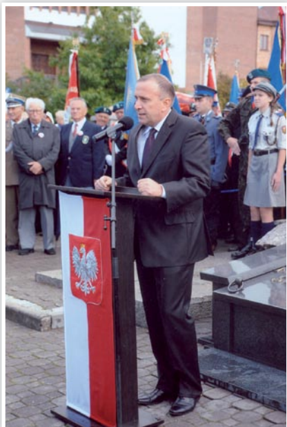
Pomnik – Grób Nieznanego Sybiraka, przemawia Grzegorz Schetyna – marszałek Sejmu RP