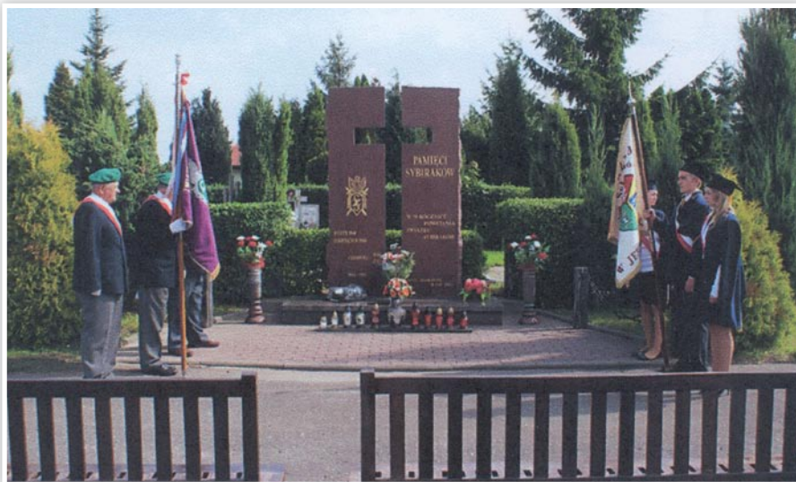
Poczty sztandarowe Koła Związku Sybiraków w Zgorzelcu i Gimnazjum im. Sybiraków w Jerzmannach pod Pomnikiem Sybiraków

17 września w kościele w Zgorzelcu odprawiono mszę św. z udziałem dwóch księży. Po mszy spotkano się w restauracji na poczęstunku.