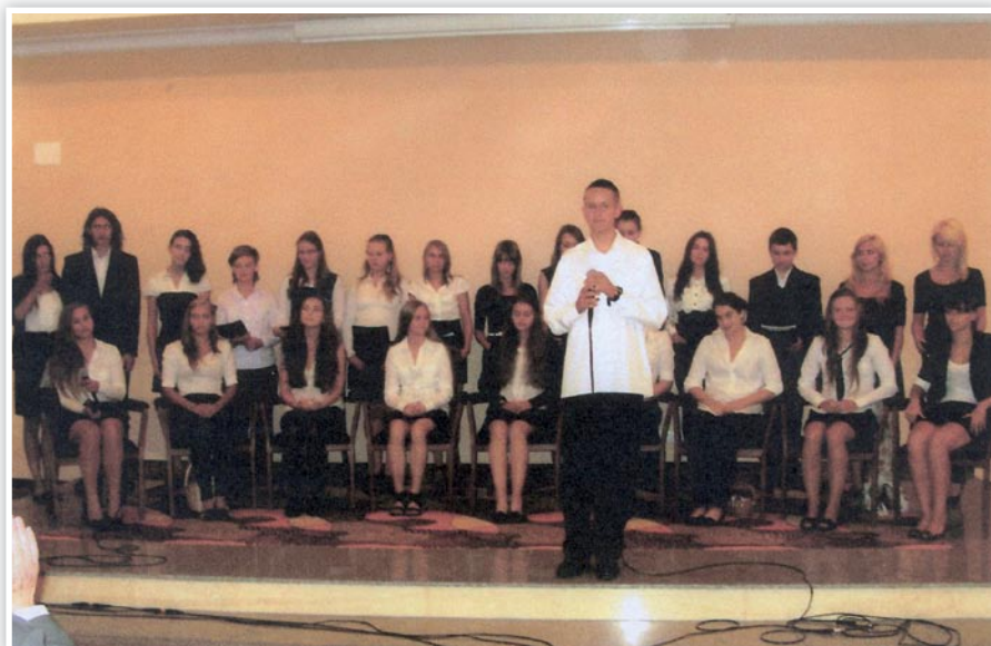
Występ młodzieży z Bolesławca

II dzień – po śniadaniu byliśmy zaproszeni na rancho Western City w Ściegnach. Przygotowano tam wiele atrakcji: jazda dylizansem, występy Indian, rzut do tarczy, napad na bank itp. Na pamiątkę każdy uczestnik otrzy-