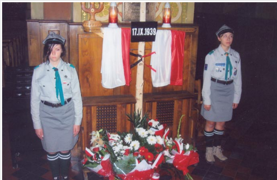
Warta honorowa harcerzy przed tablicą Golgota Wschodu