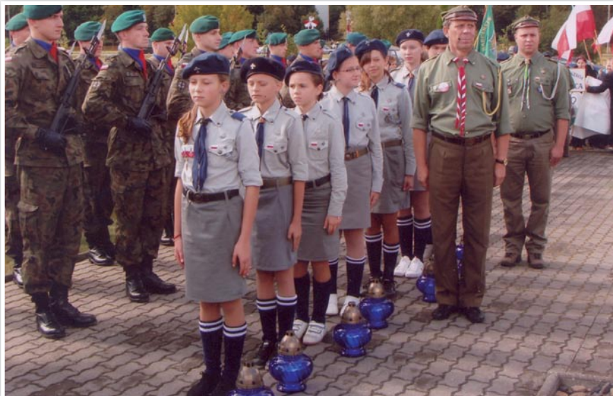
Harcerze podczas uroczystości XI Marszu