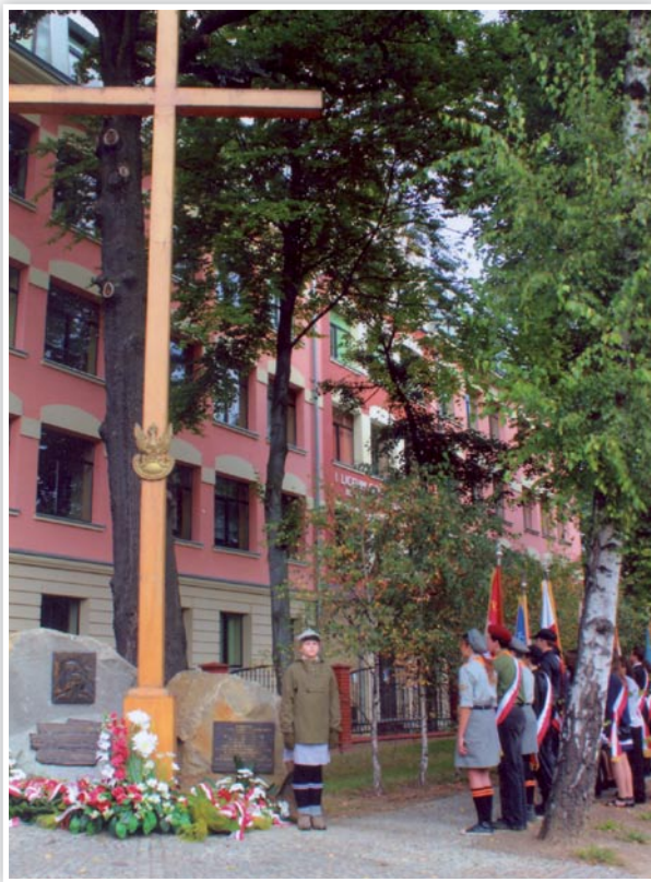
Krzyż Katyński na Skwerze Golgoty Wschodu