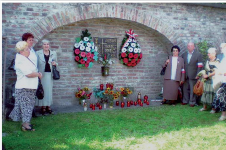
Spotkanie przy Tablicy poświęconej Sybirakom

Urząd Miejski i Garnizon Wojska Polskiego przygotowali część poświęconą 72. rocznicy agresji ZSRR na naszą Ojczyznę, Związek Sybiraków uczcił Dzień Sybiraka, a harcerze świętowali poświęcenie tablicy dziękczynnej wmurowanej w kościele Franciszkanów za wieloletnią opiekę nad sztandarem Chorągwi Harcerzy ZHP we Lwowie z roku 1933.