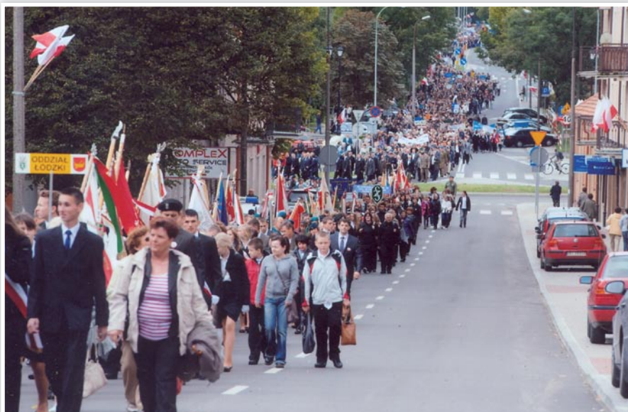
XI Międzynarodowy Marsz Żywej Pamięci Polskiego Sybiru; maszerują Sybiracy i młodzież białostockich szkół