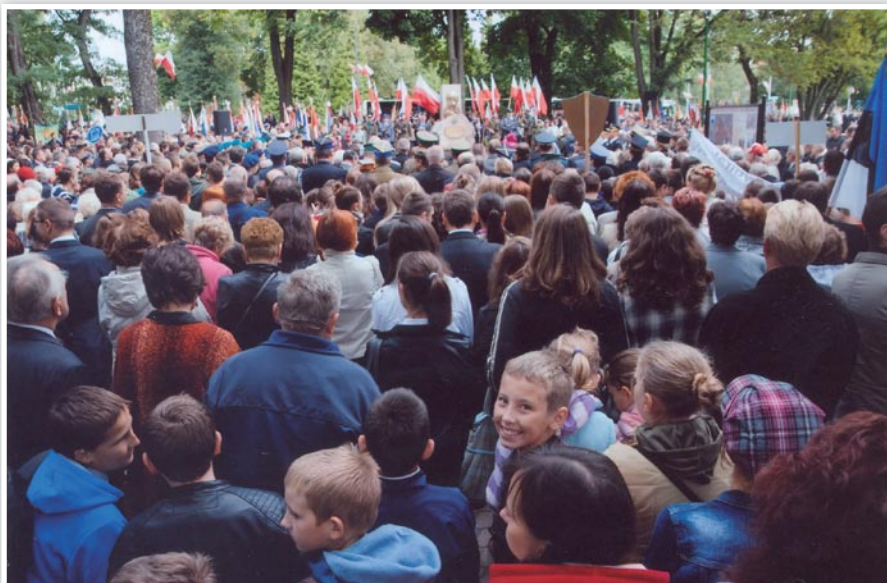
Uroczystość przy Pomniku Katyński